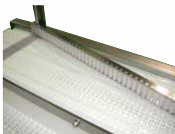
②樹脂ローラーガイド